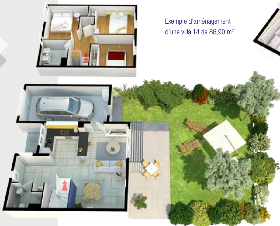
Exemple d'aménagement d'une villa T4 de 86,90 m 2

Nos logements allient confort, optimisation des espaces de vie et respect de l'environnement. Dans cet environnement privilégié, aux portes de Toulouse, Les Jardins du Berjean offrent un lieu de vie idéal pour familles et jeunes couples, désireux de mener un investissement qualitatif pour une valeur patrimoniale assurée dans le temps.